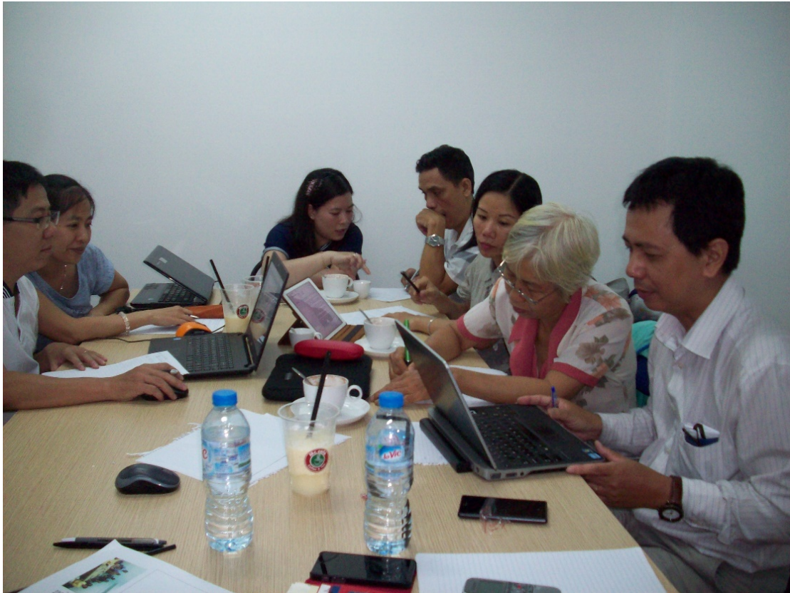
Hình 1. Các thành viên tham gia nghiên cứu trong lúc tiến hành phỏng vấn.

Trong vòng 40 phút, các thành viên tham gia nghiên cứu đã di chuyển xung quanh một cái bàn ở giữa phòng để phỏng vấn lẫn nhau, thỉnh thoảng tách ra thành các cặp (Hình 1).