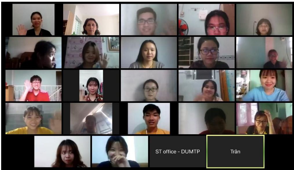
Học qua Zoom

Vào ngày 27 tháng 3, các giám đốc của Trinh Foundation Australia (TFA) đã kỷ niệm 12 năm hoạt động trên nền tảng trực tuyến. Kể từ khi bắt đầu, các hoạt động của TFA đã được quản trị thành công qua phương thức này, với các thành viên ban giám đốc và nhân viên từ khắp nơi ở Úc và nước ngoài quản lý từ xa cho phần lớn các mối quan hệ hợp tác và dự án của chúng tôi tại Việt Nam cho các mảng cố vấn, nghiên cứu và phát triển chương trình giảng dạy. TFA đã vận hành các chương trình CPD và cố vấn trực tuyến trong nhiều năm, đặc biệt là chương trình Cố vấn qua Skype Xuyên Biên giới đã hoạt động được 2 năm và dự định sẽ tiếp tục trong năm 2020. Hy vọng, các dịch vụ và những hoạt động dựa trên nền tảng trực tuyến của chúng tôi là nguồn cảm hứng cho các tổ chức khác trong những thời điểm thử thách như hiện nay.